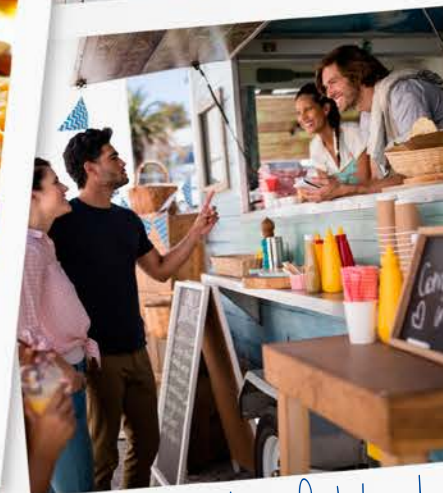
❤️ Hoy toca food-truck con amigos!