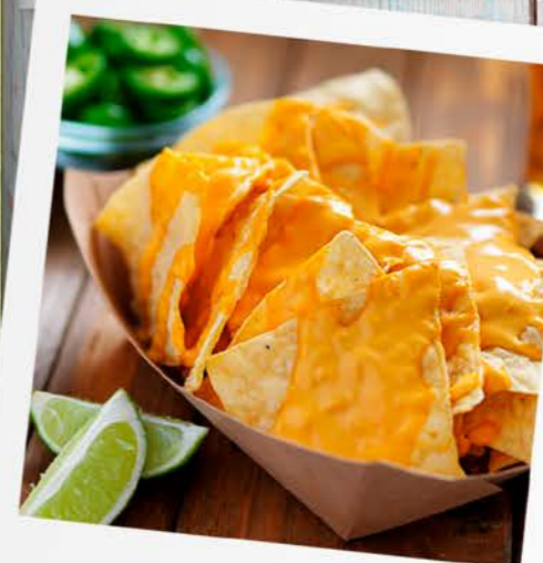
Pequeños placeres para compartir.