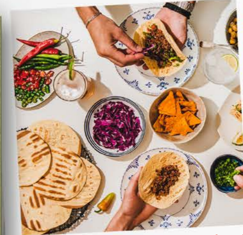
Cena 30 aniversario de Carmen. 🍷