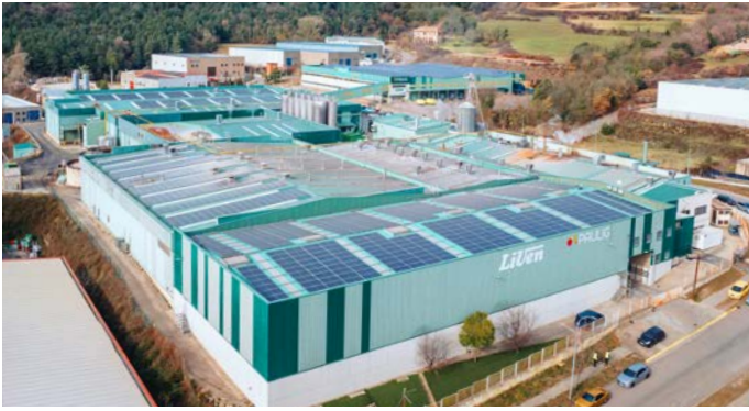
Berga · Barcelona