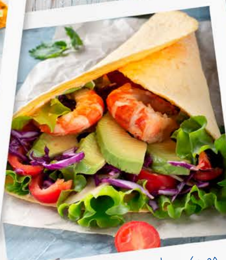
Wrap Mediterráneo 100%