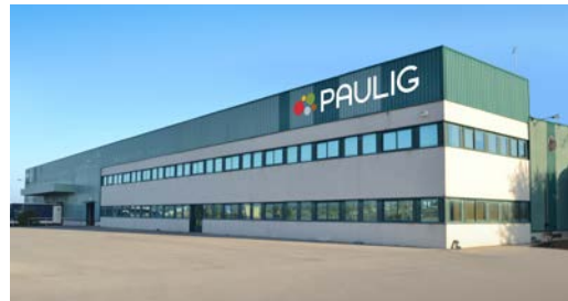
Ocaña · Toledo