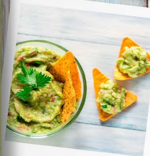
La sorpresa del día!