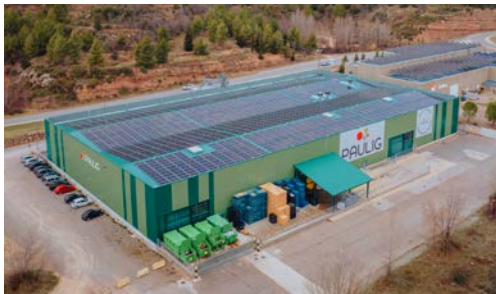
Puig-reig · Barcelona